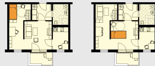
Grundriss - Wohnen